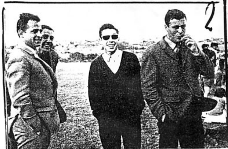
SOBRE LA ASPIRINA

Es el ácido acetilsalicílico, un producto químico usado como analgésico y antitérmico: alivia los dolores y baja la fiebre. Es el más corriente de los miles y miles de medicamentos que hay, y a más, es el más socorrido y el más popular. Tan es así que, siendo como es una marca y su nombre patentado por la casa Bayer, la Real Academia lo ha aceptado como nombre común en el diccionario. Su origen es alemán. Y posiblemente no sepas que se gastan más de 100 millones de dosis cada año en el mundo. Ni sepas, quizás, que su fabricación en un 85% es española, concretamente se hace en Langreo, Asturias.