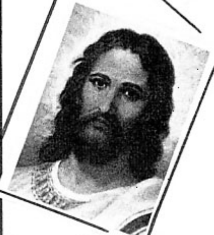
NAZARET, FALTA DE FE

Ya jubilados, hemos conocido, a más de muchos y más lugares de España, Francia, Italia, Grecia, Turquía, Egipto, Países Bajos y... tenemos como "asignatura pendiente" atravesar el charco con destino a otros continentes. Nos lo permite el tiempo de que disponemos, todo para nosotros, así como del disfrute de la familia y de la naturaleza (nuestra casa en el pueblo es un "mirador" a la era, las Quince Luces, la Corcha y todo lo "propio"). ¿Recuerdos de mi niñez?: los juegos en la plaza a la hora del recreo, y luego en la Senara y Cruz de los Caídos. Las flores que cogíamos en el campo en mayo para los altares de la Virgen en la escuela, lo cantos ("venid y vamos todos") y las catequesis del cura, Don Jesús. Las meriendas a la Griónera y las tradiciones de antaño. Como seguimos viviendo, por temporadas en el pueblo, ver lugares y cosas es recordar y volver a vivir. (sigue atrás)