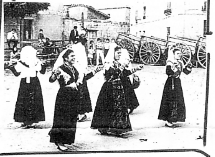
"NUESTRA HISTORIA" (3)