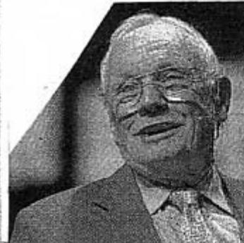
El astronauta Neil Armstrong.