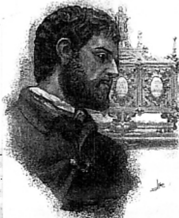
St. Juan de Avila