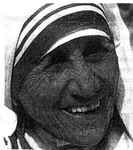
TERESA DE CALCUTA (1)

A finales del pasado agosto, el mundo celebró el centenario de su nacimiento, así como el 13 aniversario de su muerte.