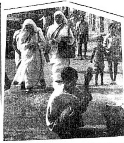
TERESA DE CALCUTA y DIANA de G. (4)

Vio una anciana que agonizaba en la calle, mordisqueada por las ratas. Sintió asco y ganas de huir; pero cargó con ella y la llevó al hospital... Teresa buscó desde entonces un "hogar para moribundos"