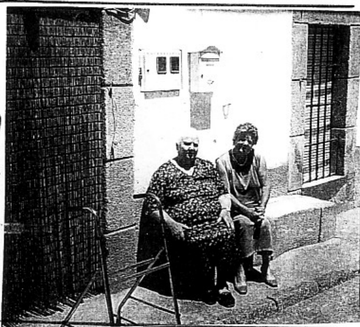
LA LUNA NUEVA DE OCTUBRE SIETE LUNAS CUBRE.

Somos nosotros los renteros de "la viña" Llegado el momento se nos pedirá cuenta del "fruto" que debemos "cosechar".