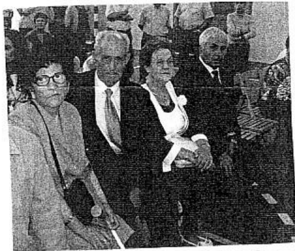
DAOIZ Y VELARDE

Y, por lo mal que lo están pasando muchos, este es el tiempo de la generosidad, del "dar" y "darse".