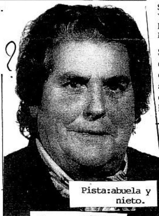
Pista:abuela y nieto.

✦ Quien quiera vivir con dignidad y plenitud no tiene otro camino más que el reconocer al otro y buscar el bien.