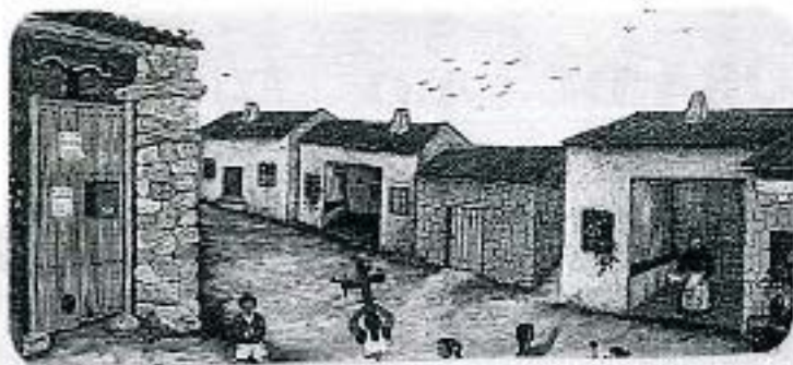
"EL CUBO" en 1.950...