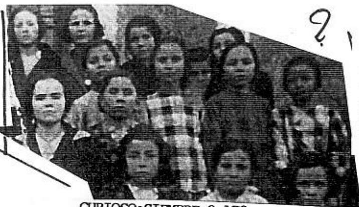
CURIOSO: SIEMPRE 2.178

Escogemos un número de tres cifras que no sean iguales (ej. 321). Invertimos los números (123).