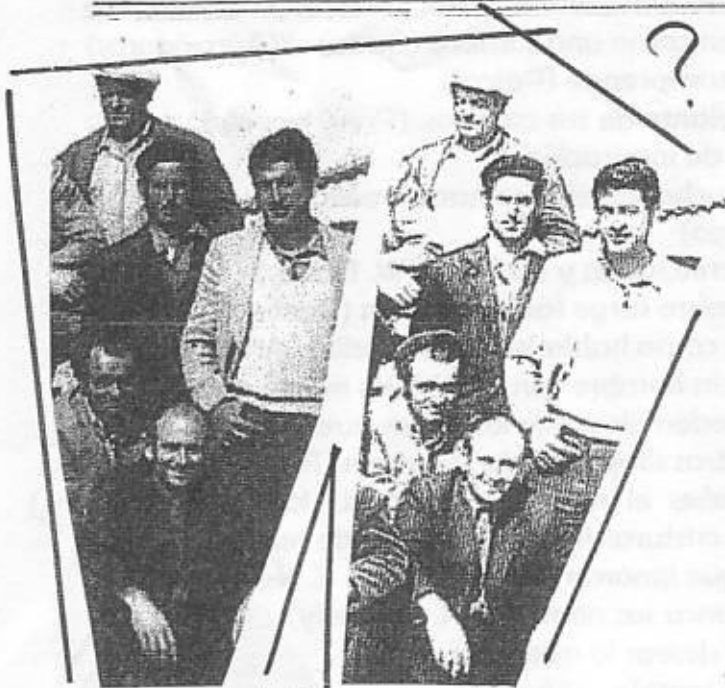
Solución al número anterior: NUEVA-RÍO

Cuando el septiembre acabes de vendimiar, ponte enseguida en octubre a sembrar. Agua de octubre, las mejores frutas pudre.