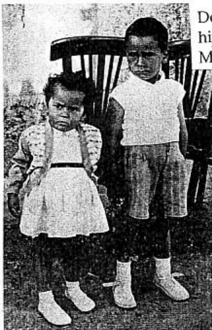
Dos hermanitos, hijos de Jesús y María.

Alemania es el país más poblado de Europa.