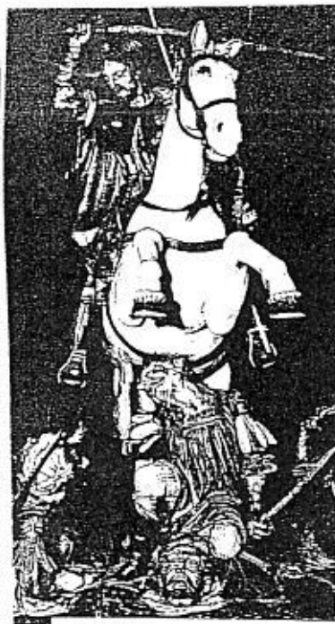
—+ SANTIAGO APÓSTOL

HAY UNA CIUDAD CON NOMBRE IGUAL EN LOS CINCO CONTINENTES Y ESA CIUDAD Y ESE NOMBRE ES...ROMA.