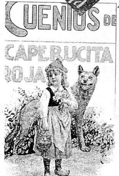
CAPERUCITA ROJA Y EL LOBO FERAZ