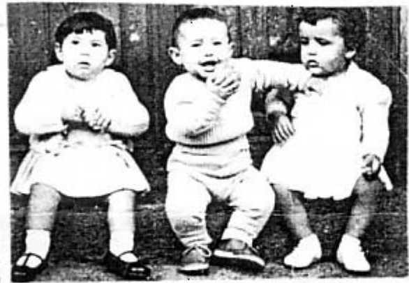
EL CUBO HACE 100 AÑOS (2)

De qué sirve una casa si no se cuenta con un planeta tolerable donde situarla. Thoreau