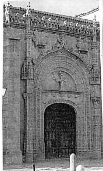
-SANTIAGO DE LA PUEBLA