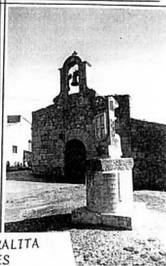
LA MORALITA GRANDES

Que pronto sea un hecho tu recuperación. Por todo...GRACIAS A DIOS.