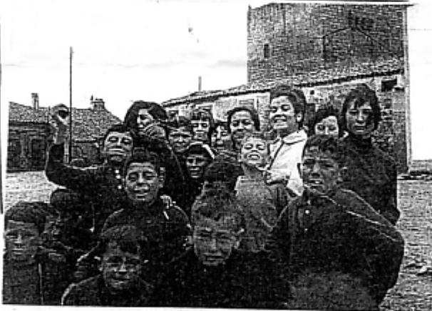
LA PERDICIÓN DE UN PADRE... TRES HIJAS Y UNA MADRE. (2)

Húmeda y seca, FUENTE DE LA RANA, piedra labrada, fontana bien hecha y única, pues sólo si llueve...manas.