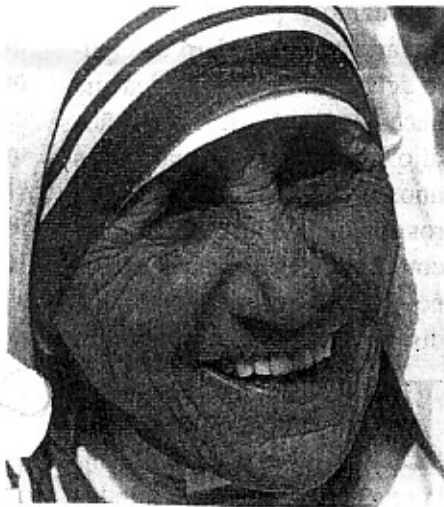
TERESA DE CALCUTA (1)

A finales del pasado agosto, el mundo celebró el centenario de su nacimiento, así como el 13 aniversario de su muerte.