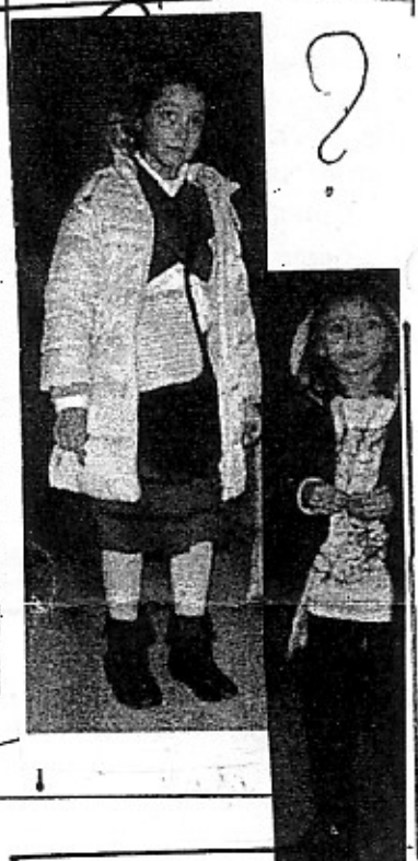
NIEVE ANTES DE MARZO ES "ORO BLANCO"