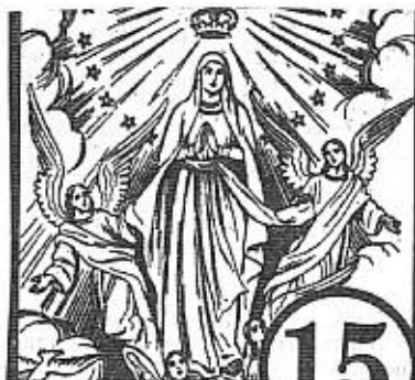
LA ASUNCIÓN DE MARÍA